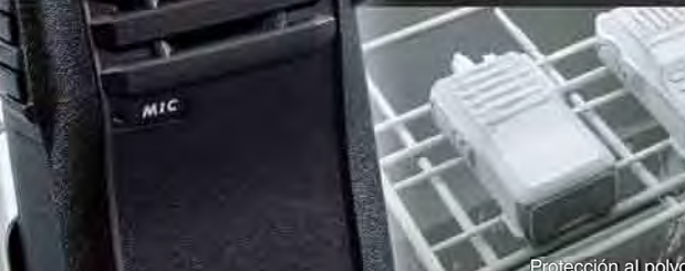
Protección al polvo