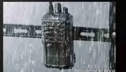
Resistente al agua